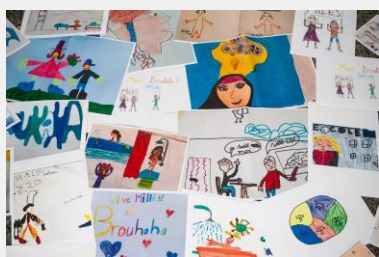
Dessins adressés aux responsables de l'émission