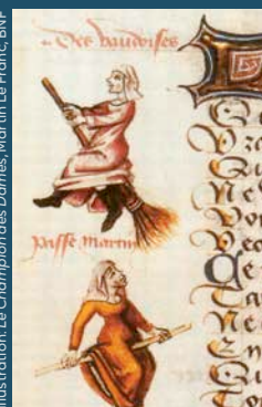
Illustration: Le Champion des Dames, Martin Le Franc, BNF

La première image de sorcière sur un balai se trouve dans le livre Le Champion des dames , écrit vers 1440.