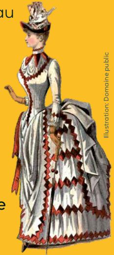
Illustration: Domaine public

En effet, à l'époque une femme respectable s'habillait plutôt comme ceci →